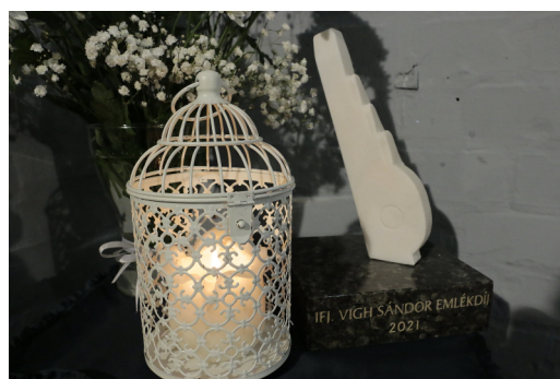
Ifj Vigh Sándor Emlékdíj